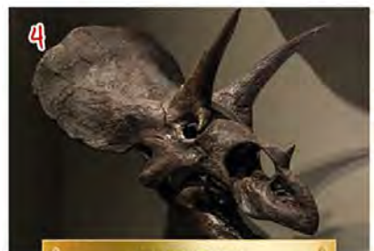
TRICERATOPS TRICERÁTOPS • TRICERATOPO 250 OS - BONES KNOCHEN • BEENDEREN HUESOS • OSSA